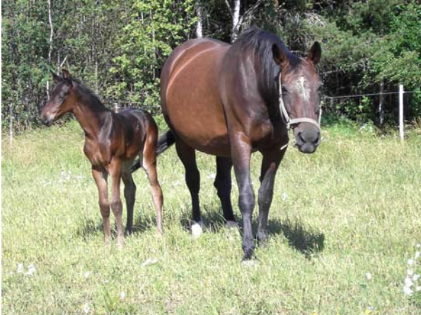
Kuva: Puksu varsansa kanssa laitumella

Aikanaan kun tämä varsa tulee tekemään omia varsoja, niin saadaan jatkumaan kantatammamme Arabellan perimää.