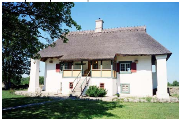
Kuva: Majapaikkana toimii tyylihuonekaluin sisustettu ja huolellisesti entisöity ”huvimaja”

kanssa pääsee hyvään rytmiin. Veikkaan pisimmän laukkajakson pituudeksi parisen kilometriä.