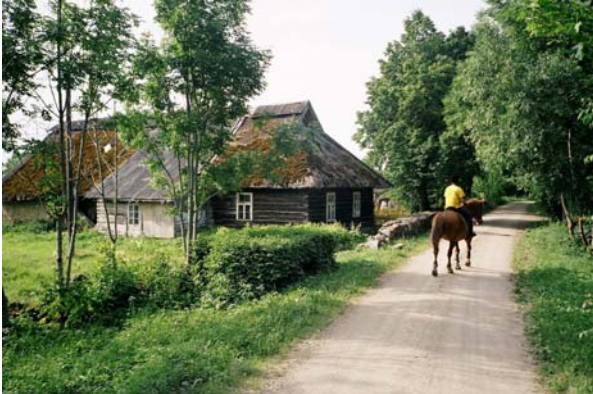
Kuva: Maargit Kallas tunsi lukuisia hienoja ratsastusreittejä

Viron suurin saari Saarenmaa on viehättävä lomakohde ratsastamista harrastaville, sillä se tarjoaa monia kiinnostavia vaihtoehtoja hevosurheilun ystäville. Tämänkertainen ratsastusmatkani vei Töllusten kartanoon Etelä-Saarenmaalle.