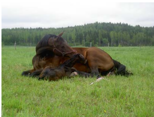
Kuva: True Perrier syntyi laitumella ja tässä levätään synnytyksen jälkeen.

Kolmas varsa, Espen Perrier, syntyi keväällä 2005 ja taas tuli komea orivarsa. Kasvaimen takia Puksun kanssa eletään nyt vuosi kerrallaan ja täysin sen ehdoilla.