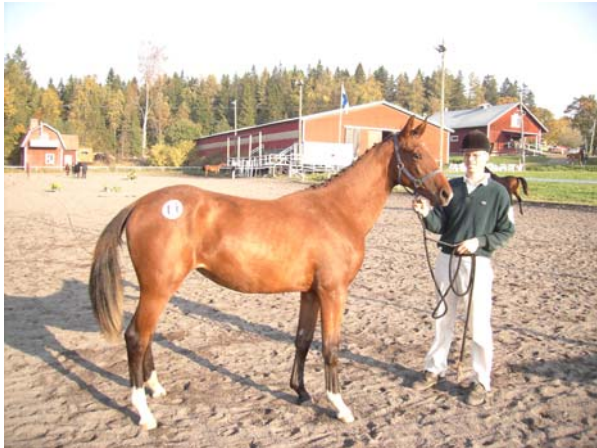
Kuva: ennen kehään menoa seistään vielä nätisti

No siitähän ei kovin hyviä arvosanoja saatu tuomareilta. Mutta tulihan kokemusta matkailusta ja opetettua varsa autolla kulkemiseen. Kun irtohypyitimme kaikki varsamme viikonloppuna, osoitti Viivi hyviä hyppylahjoja, joten vaikka missin ura ei urkenisikaan niin kilpahevosena sillä lienee töitä tiedossa.