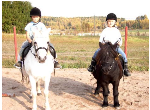
Kuva: Julle&Milli ja Nea&Senni

Jullehan jo painelee ravia (omasta mielestään laukkaa) vanhalla pohjalla täyttä päätä, mutta nopeasti on Neakin päässyt alkuun ja ravaa jo parin harjoituskerran jälkeen ilman taluttajaa. Parivaljakko on saamassa vahvistusta Isabellasta, joten poneille on pian kovaa kyytiä luvassa.