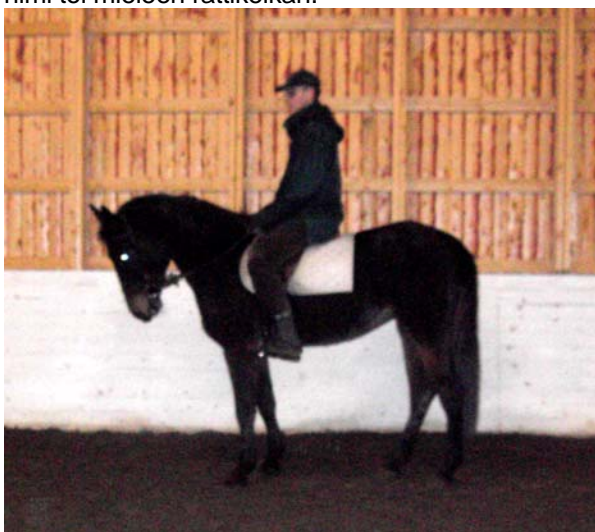
Kuva: pikku Siirin ensimmäinen testaus

Se sai nimen Siiri, koska alkuperäinen Latvialainen nimi toi mieleen rattikelkan.