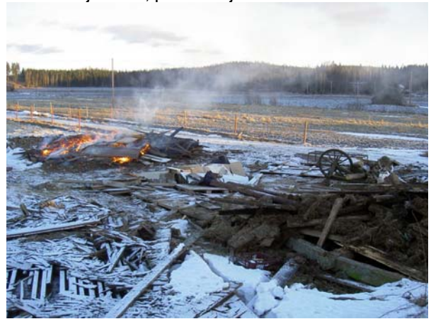
Kuva: Maneesin paikalta purettiin vanha lato

Vielä on toki kaikkennäköistä pientä laitettavaa, kuten suojalaitaa, pihatöitä jne.