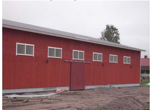
Kuva: Ja tällainen rakennus siinä on nyt