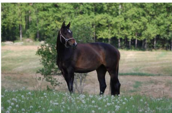
Kuva: tamma Greta Garbo

Toivotamme hänelle menestystä uuden kumppanin kanssa.