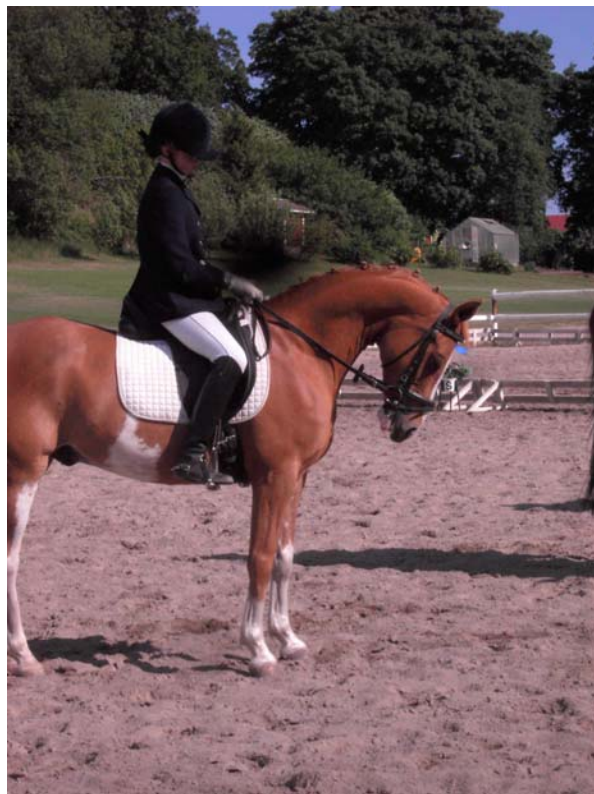
Kuva: ensimmäistä kertaa palkintojenjakojonon kärjessä