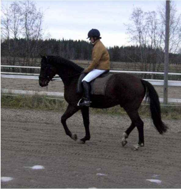
Kuva: Wiksu ja Tiina aloittelemassa verryttelyään pakkasen kovettamalla kentällä

Wiksi käyttäytyi kuitenkin kokoajan yllättävän hyvin, mitä nyt alkuun pörisi häntä pystyssä. Radalla se pelästyivät maneesin seinässä olevaa peiliä, ja sen jälkeen sitä oli hankala saada myös katsomon ohi. Samoin se lisäili ohjelmaan omia liikkeitään eli peruutuksia ja kiemuroita. Mutta kokonaisuutena harjoitus teki tehtävänsä ja seuraava kerta on varmasti astetta taas parempi. Ennako-odotuksiin verraten se kaikenkaikkiaan käyttäytyi paljon wiksummin.