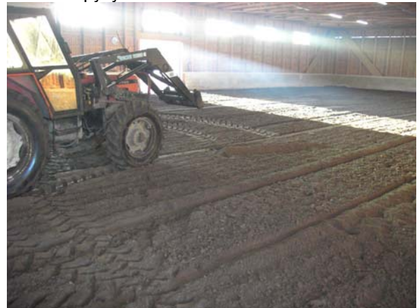
Kuva: pohjan pehmittämistä, maneesissa työskentelyn haittana on traktorin pakokaasut jotka näkyvät kuvassa

Liian pehmeä pohja rasittaa hevosten jänteitä ja liian kova taas ottaa nivelien päälle. Joten sopiva kimmoisuus ja pito on elintärkeä hevosten kunnossapysymiselle.